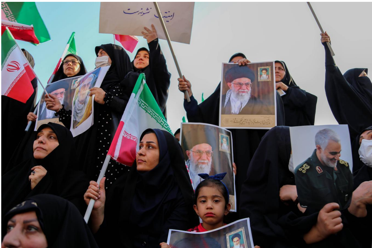
Mnoge podeželske muslimanske tudi danes podpirajo na slikah upodobljene verske oblastnike. Slika je iz Irana septembra 2022.