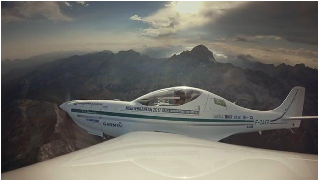
Prizor iz slovenskega dokumentarnega filma Temni pokrov sveta.