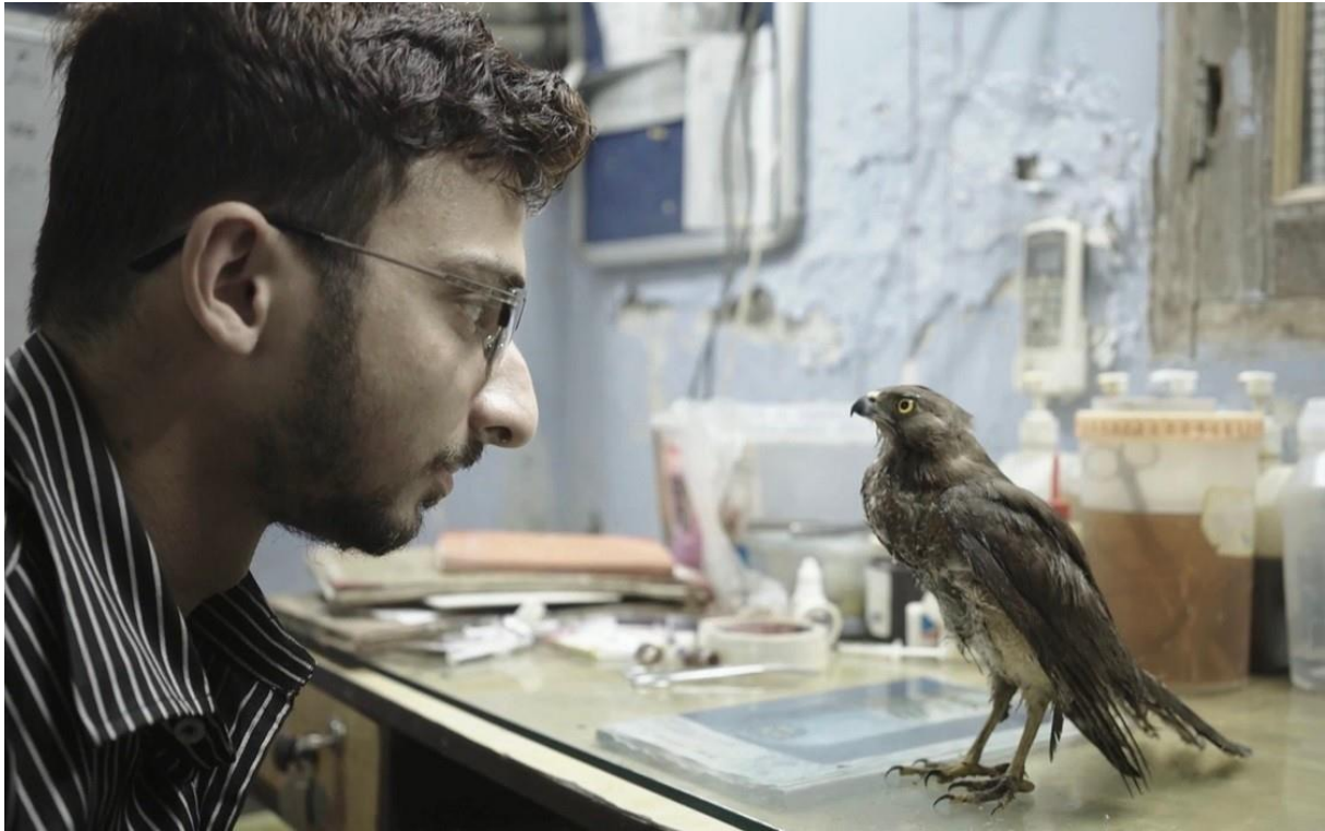
Prizor iz filma Vse kar diha (All That Breathes).