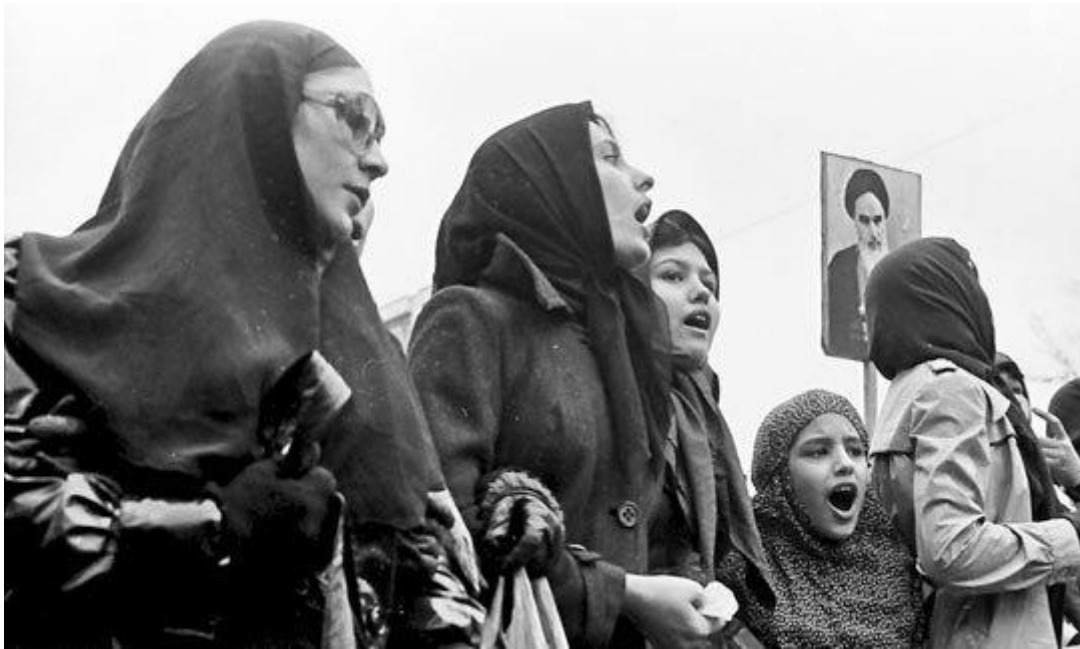
Potem ko je iranska princesa Soraya javno raztrgala naglavno ruto, so muslimanke iz iranskega podežlja na protestih zahtevale ravno obratno, hidžab in Homeinija.