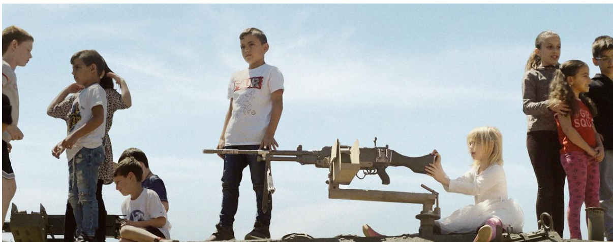
Prizor iz filma Nedolžnost (Innocence) z izraelskimi otroci pri obveznem vojaškem urjenju.