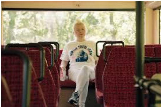
Prizor iz dokumentarnega filma Ljubezni Patricie Highsmith (Loving Highsmith).