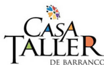
Casa Taller de Barranco