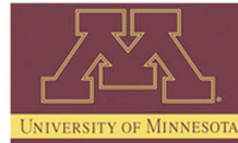
University of Minnesota