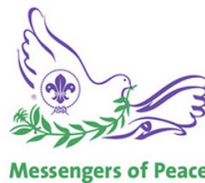
Messengers of Peace